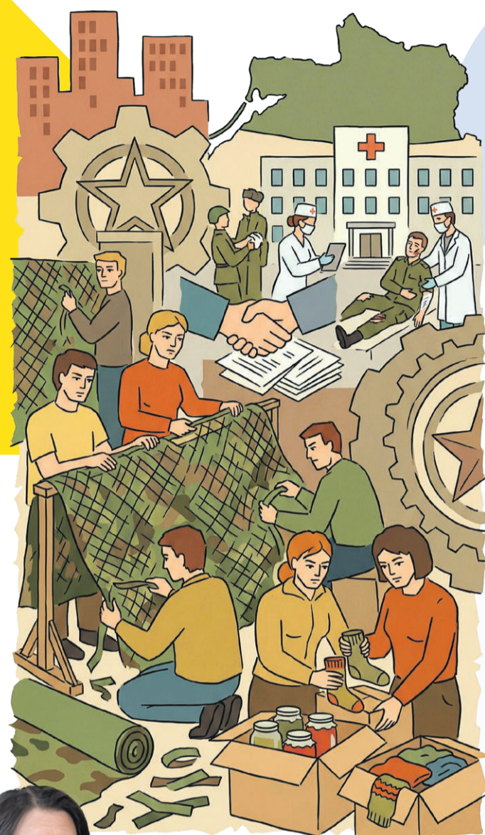
Иллюстрация: Сергей Попов

От юридической помощи раненым в госпиталих до плетения невидимой защиты в сельских мастерских — калининградское отделение СПРАВЕДЛИВОЙ РОССИИ вместе с движением «Боевое братство» развернуло масштабную сеть поддержки участников СВО. О том, как с миром по нитке собирается общая победа и почему в этой работе не бывает бывших, — в нашем материале.